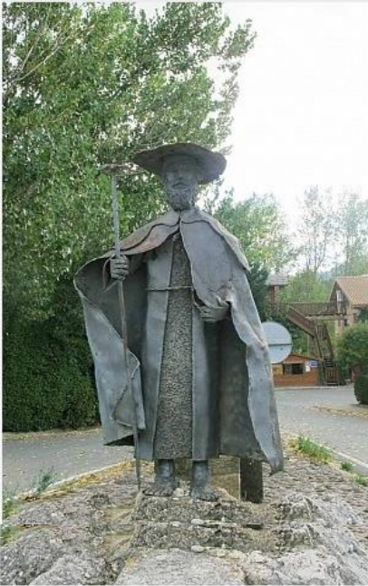
No caminho, pontos turísticos e históricos

Cada viagem é projetada para oferecer o melhor do destino; caminhar por terras que só os locais conhecem, saborear os alimentos frescos e típicos de cada lugar, e abraçar cultura e natureza encontrada ao longo do caminho. Caminhar é uma forma de viajar de mínimo impacto e muito saudável. A Country Walkers (CW) é ativa nas práticas de sustentabilidade e responsabilidade social, apoiando iniciativas e programas locais.