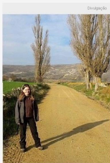
Liberdade, conforto e segurança ao longo da jornada

A viagem começa na estação de Trem de Pamplona, com um traslado para Roncesvalles, onde se dá o início da caminhada.