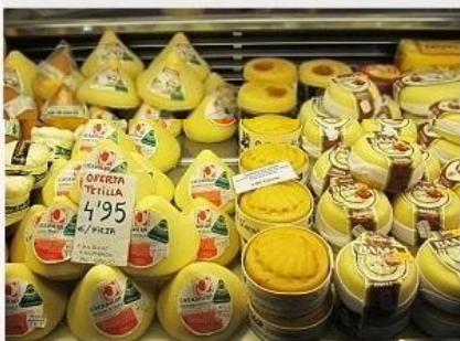
Queijos e bons vinhos aguardam os peregrinos.