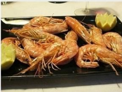
Roteiro inclui também um tour pela gastronomia local