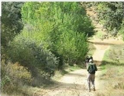
Aventureiros carregam apenas pequenas mochilas