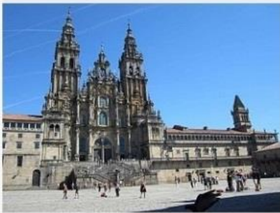
Catedral de St. James

O viajante atravessará diversas paisagens de aldeias de montanha do País Basco, os vinhedos de Rioja, as cidades de Castile e León, e os pastos verdejantes da Galicia.