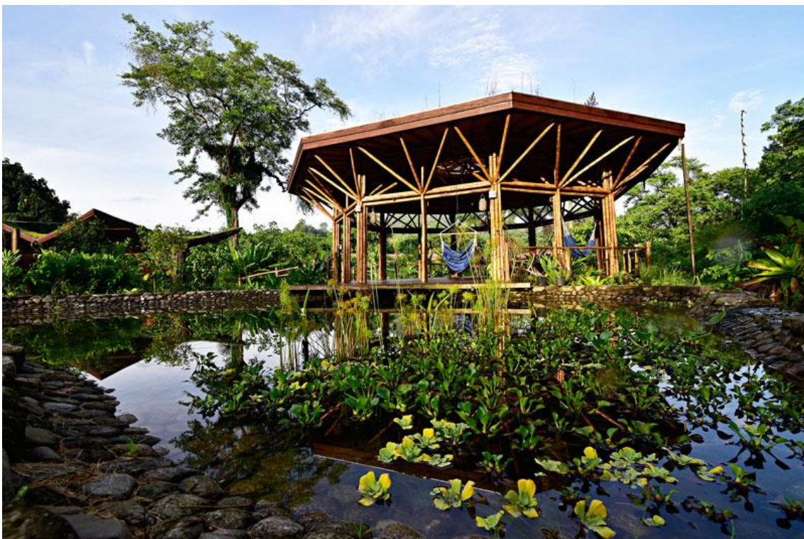
Espaço lounge com redário

A propriedade, traz ao hóspede um conceito diferente de gastronomia, que valoriza os alimentos e a cultura regional, integrando-os a receitas saudáveis sem desperdício! Há aproveitamento total em todos os alimentos, o destaque fica por conta do alimento mais regional de Ubatuba: A banana.