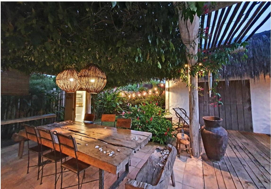
Área para refeições