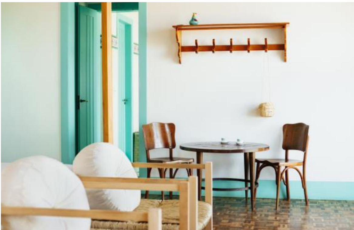
Suíte master Villa Nandie

O privilégio dessa suíte de 25m 2 com varanda privativa, é contemplar o pôr do sol da Casa brasileira que é um espetáculo a parte. Um degradê de tons de rosa a salmão contrastando com o azul turquesa do mar e o céu. Esse momento tão especial não poderia deixar de ser evidenciado.