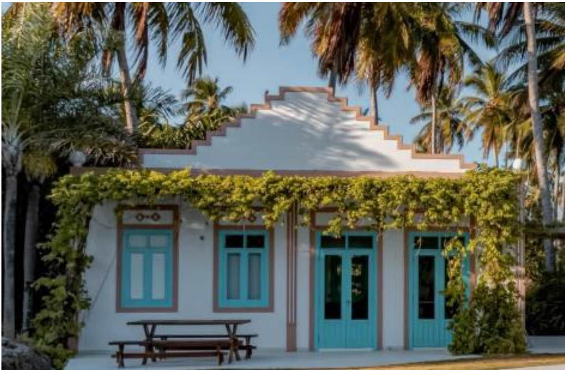
Bangalô Palmeira Triangular