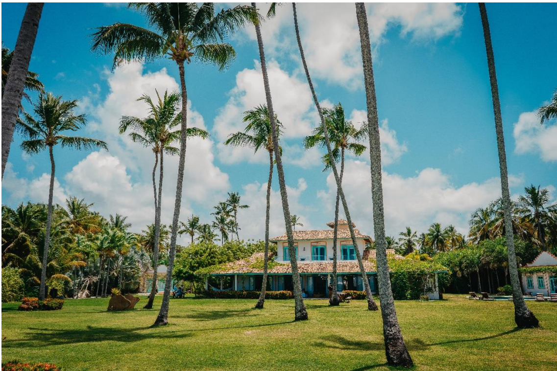
Vista geral da Casa Brasileira