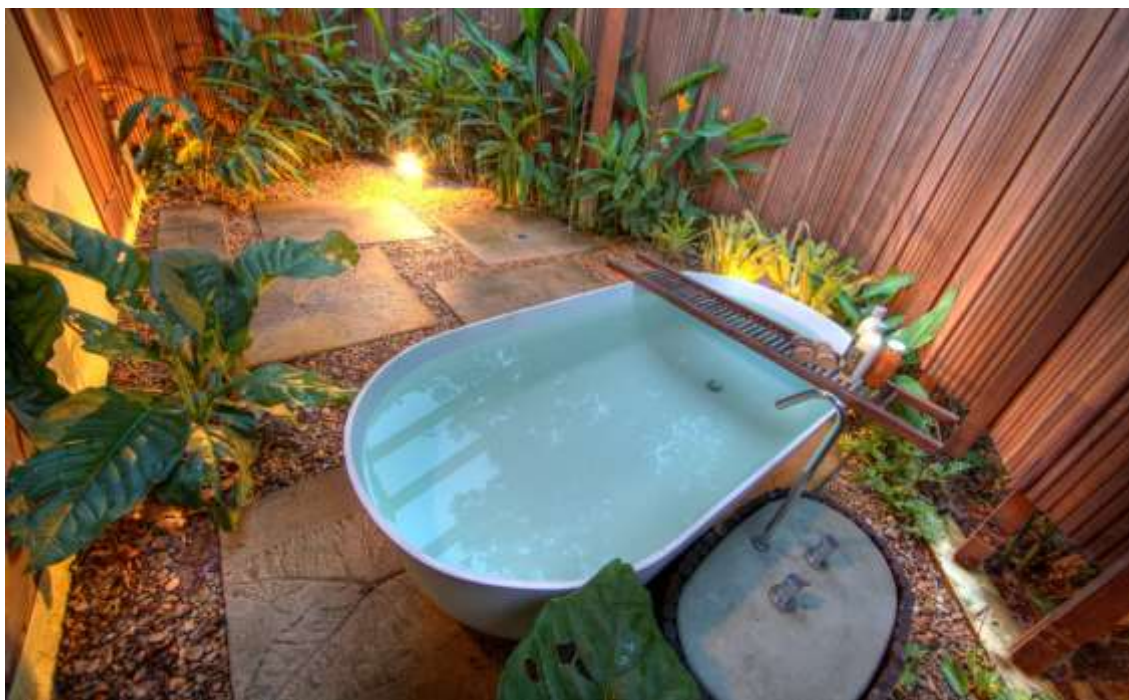
Banheira externa - Bangalô Especial

Projetado individualmente na mata nativa e, com pé direito elevado e uma linda banheira externa em jardim privativo, conta com 79 m 2 , cama king-size, 2 sofás-camas com lençóis Trousseau de 300 fios, secador de cabelo, amplas janelas e vistas para a floresta. Acomoda até 4 pessoas.