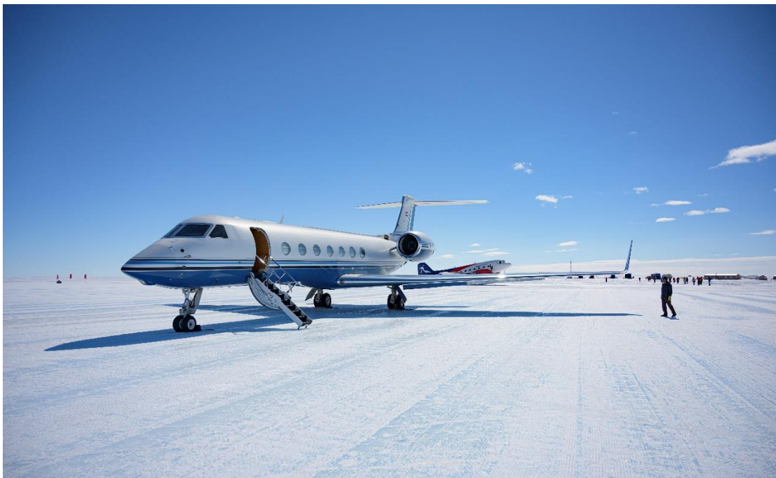
Jato de longa distância Gulfstream G550

Durante o trajeto desde a base dos Camps até a colônia dos pinguins, o transporte será realizado em pequenos aviões modelo Basler BT-67, equipados para o frio gélido da Antártica. Estas aeronaves, são capazes de comportar confortavelmente até 12 exploradores e a equipe local, responsáveis por tornar a exploração ainda mais especial.