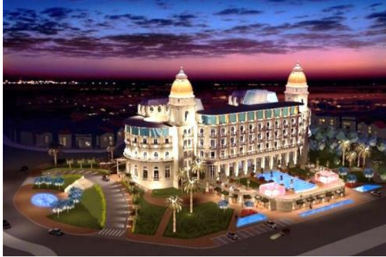
SOFITEL MONTEVIDEO CASINO CARRASCO & SPA

Com 116 quartos e suítes de luxo, o hotel oferece um alto nível de conforto e privacidade. No seu interior há spa, restaurante, bar e um renomado casino. Sua localização é excelente.