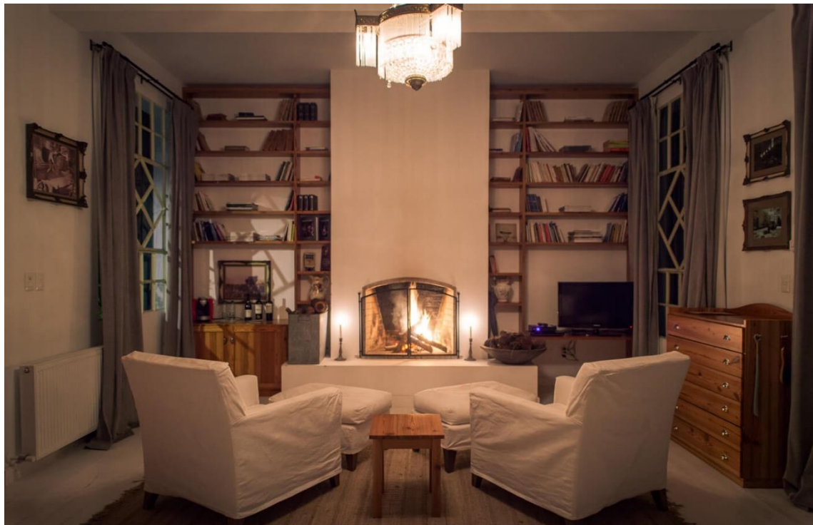
El Charco Hotel

Os quartos do Charco Hotel estão equipados com TV, base para iPod, ar-condicionado e banheiro privativo. Alguns quartos têm vista para o rio, outros para a cidade. O hotel conta ainda com uma lagoa e um jardim encantador.