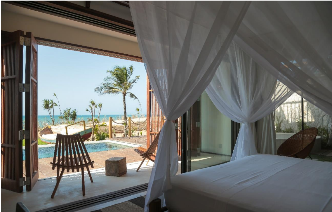
Suíte Categoria Luxo