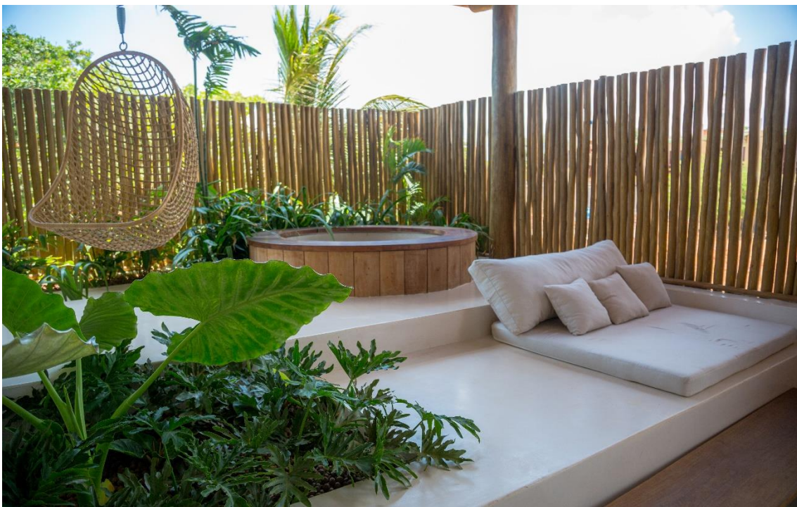
Suíte Master Luxo

Com 90m 2 as suítes da categoria master luxo: Jeri e Dunas, prometem proporcionar uma experiência deslumbrante, com a vista panorâmica de 180° para a idílica Praia da Malhada. Aproveite o jardim privativo com hidromassagem e ducha para relaxar e curtir a paisagem.