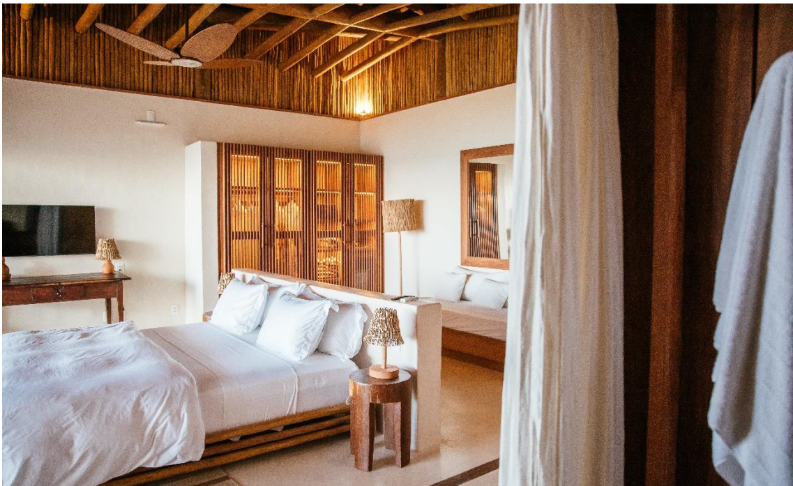
Suíte Categoria Master