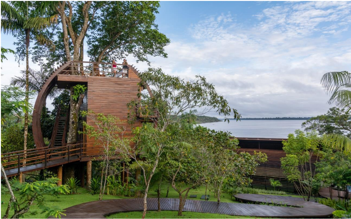
Casa na Árvore